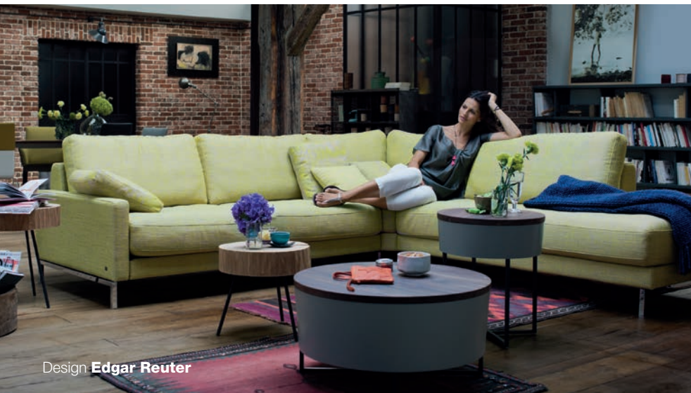
Design Edgar Reuter